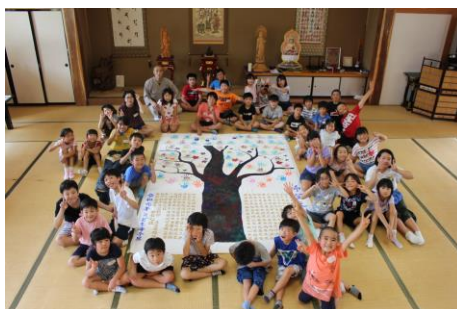
令和元年の寺子屋で制作した令和希望の樹